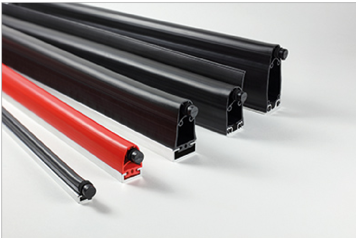
Mayser Sensorprofilreihe SP: Große Auswahl an Fuß- und Profilgeometrien