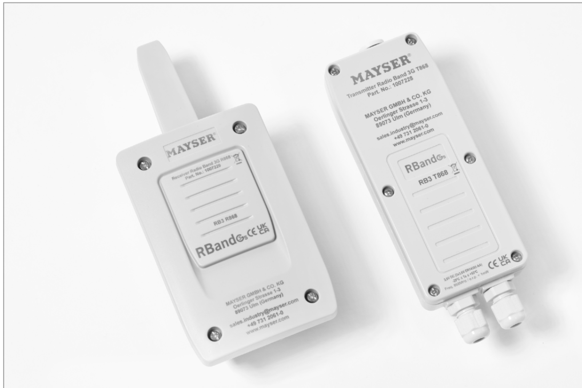
Universelles Funkübertragungssystem als ideale Ergänzung zu Mayser Sensorprofilen SP